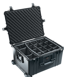
1624 With Padded Dividers