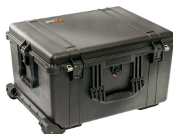
1620NF No Foam