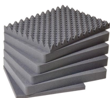
1621 Jeu de mousses de rechange, 6 pièces