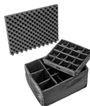
1625 Cloison en mousse