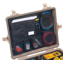
1609 Pochette couvercle