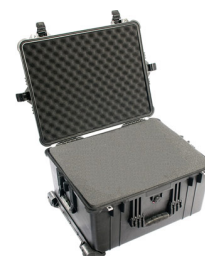
1620WF With Foam