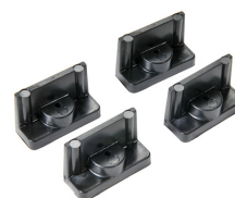
1507 Supports rapides - jeu de 4